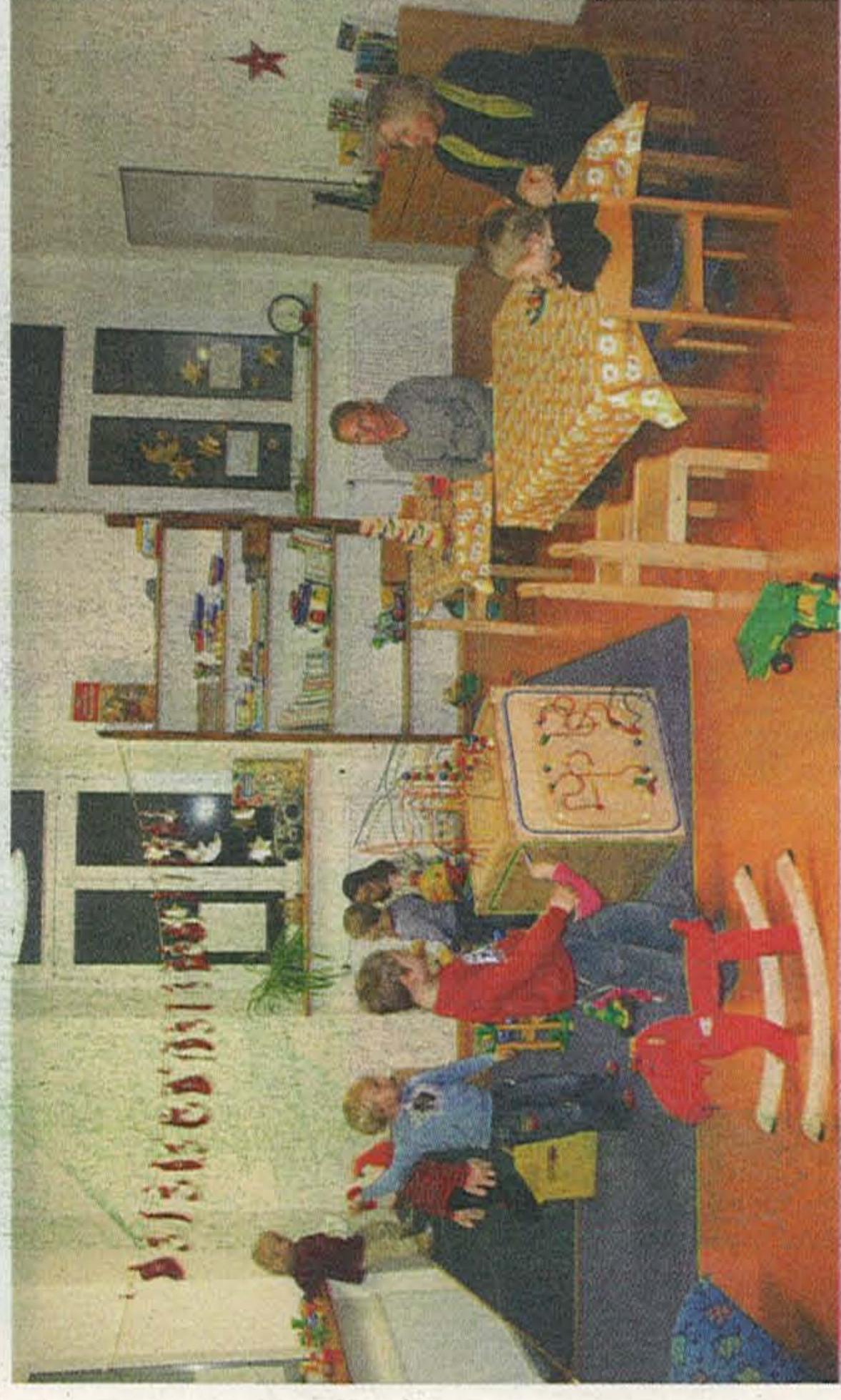
Mit der Verlegung des Familientreffs von der Grundschule Mühlhofen in die Ortsmitte der Gesamtgemeinde ist der Kleinkindbetreuung eine zusätzliche Wertigkeit verliehen worden.

Gebäude Regenbogen zu verzichten, die Musikschule aufgrund von Synergieeffekten in die Lichtenbergschule zu verlagern und die frei werdende Alte Schule zur Weiternutzung durch Vereine zu sanieren. Im Herbst 2010 beauftragte das